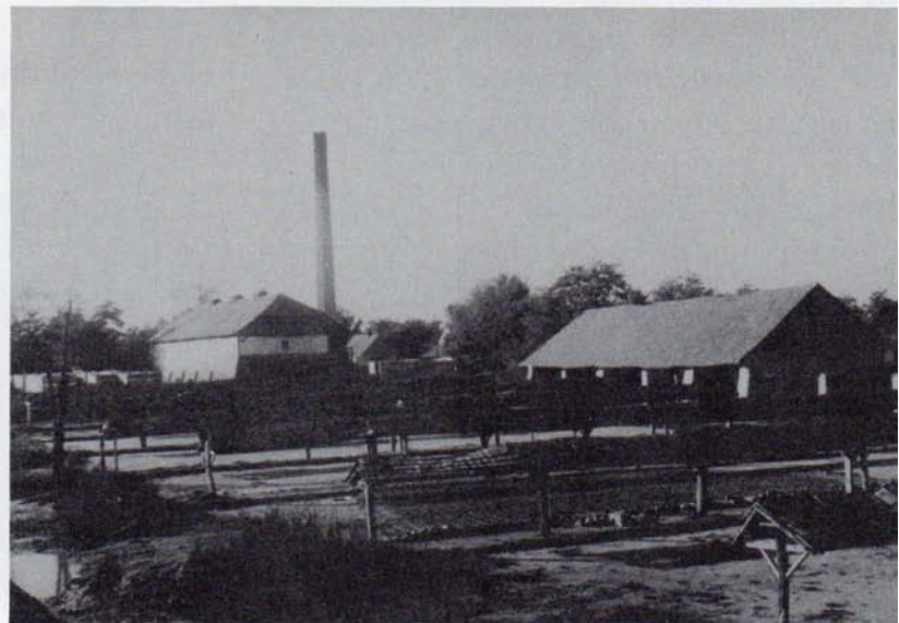
Ziegelofen. Ziegelschlagplätze mit Trockenhäusern.